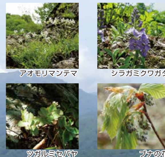
アオモリマンテマ