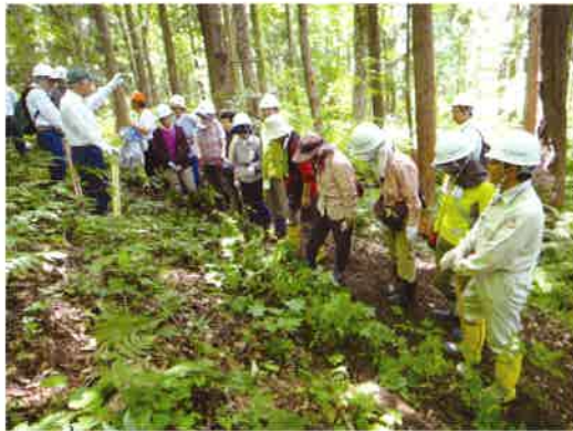
市民(一般公募)による自然再生活動

マップ)を策定しました。現在、これらの指針を基に関係行政機関、自然保護団体、NPO、学識経験者と連携して、白神山地周辺地域の森林空間利用タイプに分布するスギ人工林について、広葉樹林化等を図るなどの自然再生活動を実施しています。スギ人工林を広葉樹林化等していくには、100年単位の息の長い取組みが必要ですが、地域住民やボランティア、企業など多様な参加を得ながら、生物多様性の向上やゆたかな地域づくりに貢献していくことが重要と考えています。