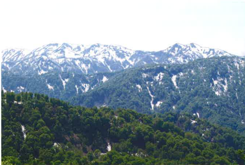
津軽峠からの向白神岳