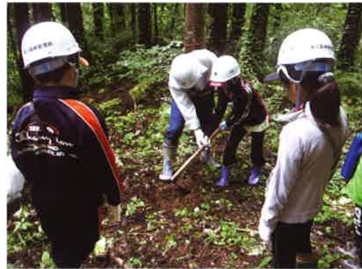
森林環境教育(小学生植樹体験)