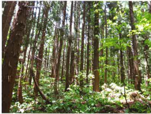
スギ人工林(自然再生拠点)