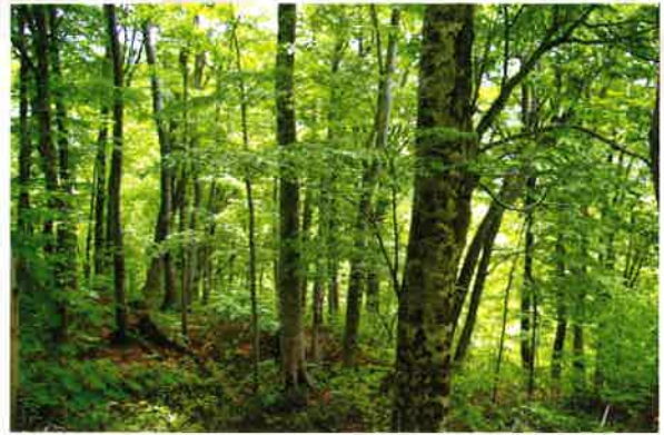
長期的目標の広葉樹林