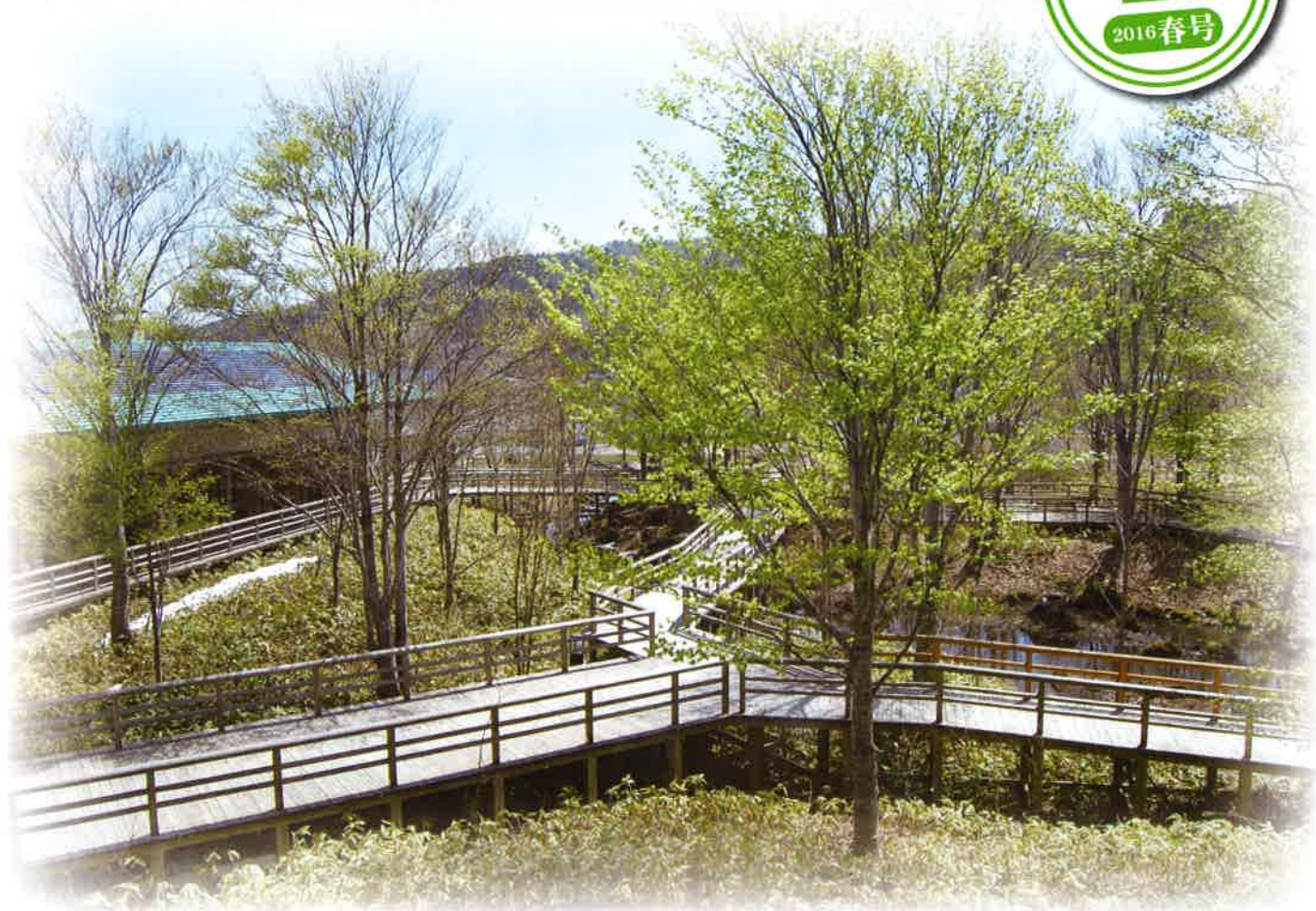
新緑のビジターセンター