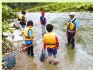
ピオトープで大発見