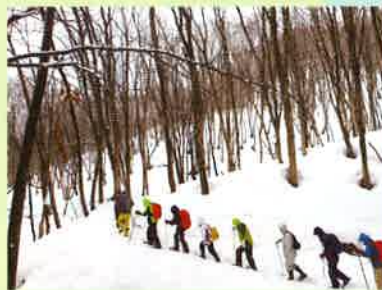
かんじぎトレッキング