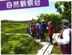
白神バードウォッチング