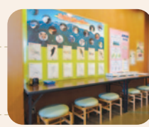
めりえコーナー(受付のとなり)