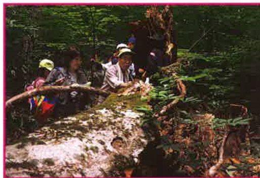
7月 森のりんねを実感

センターでは、行事のあとでアンケートをとってご意見をいただいています。参加者の皆様のご希望を取り入れて、より充実した行事を作っていきたいと考えておりますので、これからもよろしくお願ひします。