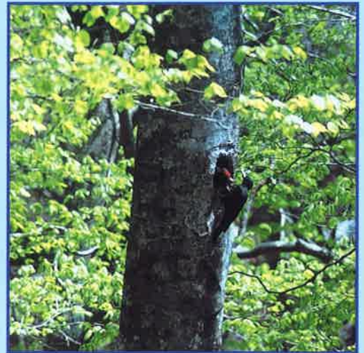
～抱卵交替～ 笹内川 2001.5.1

クマゲラは、日本最大のキツツキで、体長約45cm。黄色い眼鏡に赤いベレー帽、そして真っ黒なマントをかぶったようなケラです。昭和53年に秋田県森吉山で繁殖していることがわかるまでは、北海道にしかない鳥になっていました。事実、昭和9年に秋田県八幡平の国有林で捕獲された時にも、当時の鳥学会は、北海道からの渡り鳥とみなしたのでした。ですから、本州では「幻の鳥」だったのです。しかしよくよく調べてみると、江戸時代の古い記録の中にクマゲラの模写した絵までが存在し、「クロゲラ」とか「屋マゲラ」、そして東北地方ではクマゲラのことを「ヤマガラス」と呼んでいたことがわかりました。このような方言があるということは、クマゲラは古くから本州の山の中でひっそりと暮らしてきたという裏づけにもなるのではないのでしょうか。