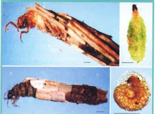
写真2 いろいろなトビケラたち

いろいろなトビケラたち。左上は植物の破片で筒型の巣を作るホタルトビケラの一つ、右上はコケの葉を細かく切って平らな巣を作るヒメトビケラの一つ、左下は正方形に切った葉を規則正しく並べて筒型の巣を作るカクツトビケラの一つ、右下は砂粒をつづって巻き貝の殻に似た形の巣を作るカタツムリトビケラの一つ。カタツムリトビケラは十二湖の小川で、そのほかは弘前市久渡寺近くの小川で見つけたものです。棒の長さはどれも1ミリ。