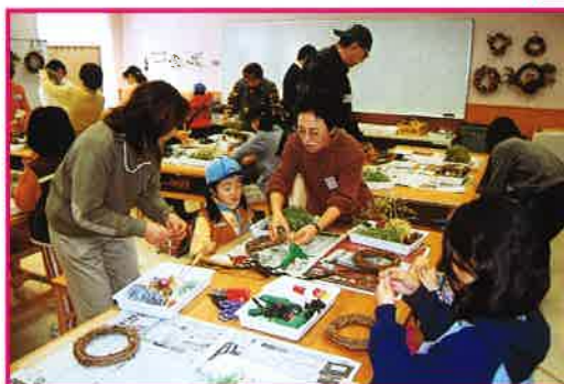
12月 材料選びもリース作りの楽しみ