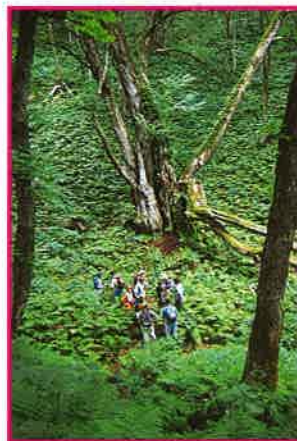
8月 森の神秘さとカツラの大きさに感動