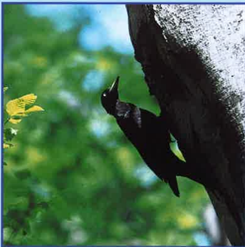
～給じに来たメス～ 中村川上流にて 1994.5.14

しかしクマゲラが有名になると同時に、クマゲラを見たいとか写真を撮りたいというカメラマンが殺到し、クマゲラの繁殖地を土足で踏みこむ行為が多々あったことも事実です。私たち研究者が調べた結果、本州では9つの繁殖地が発見され、そのうち8ヶ所は青森県内に、しかも7繁殖地は白神山地なのです。これはどういうことなのかというと、白神山地のクマゲラを保護することができれば、本州のクマゲラを保護することになるとも極言できるかもしれません。ですから白神山地が世界自然遺産として脚光を浴び、観光客が大勢押しかけるのは、あまり好ましくない現状ともいえます。世界最大級のブナ林の白神山地の自然をみることは結構なのですが、空き缶