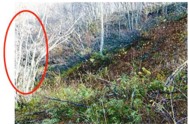
図2 不動点から撮影した地すべりによる島状植生（丸で囲む）の移動（上：2009年8月中野撮影、下：2014年8月熊谷撮影、矢印：不動地の立木）

地すべりは図-1のように、地塊の移動によって、その背後に残された土地との間に急斜面（滑落崖と呼ばれる）を作り出すことが多く、移動した土地（移動体と呼ぶ）はもとの斜面より緩い傾斜の斜面を作り出します。逆に末端は地すべりの移動が抑えられるため土地が盛り上がるあるいは河川で浸食されて、急斜面を作ることが多いです。さらに、すべり面での摩擦抵抗の大きさは場所によって違いますが、それによって地すべりの移動地塊に圧縮や引っ張りの力がかかります。その結果、キレツや段