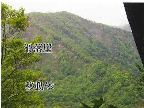
図3 暗門ブナ林散策道が横切る大規模な地すべり地形（滑落崖（中央左）では高木が欠け、移動体（下左）ではブナ林やサワグルミ林が覆っている）

図-3は、岩木川上流部にある高倉森から西目屋村暗門滝入口のブナ林散策道の通る斜面を望んだものです。写真の下半部にある移動体の緩斜面には樹高30mに及ぶブナ林やサワグルミ林が立地していますが、滑落崖は急で雪崩常襲地となっているため低木林が主になっています。さらに、地すべり地の凹凸がある関係で散策道は緩急変化に富んでいますし、途中には地すべり地の地下水が湧き出す冷たい清水も見られます。ここは、幅1kmを超える大規模な過去の地すべりでできた斜面ですが、その中にある幅50m程度の小規模な地すべり地で、それを縦断する線に沿って植生調査をしてみると、図-4のように滑落崖と移動体さらに移動体の末端部で、それぞれ現れる植生の種類が違います（三島ほか，2009）。