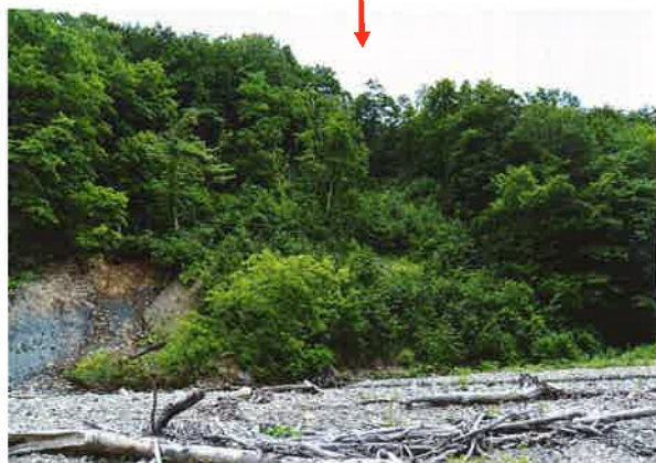
図5 大川右岸での地すべり発生（上：2006年）と同じ場所の急速な植生回復（下：2016年）（矢印は同じ位置）